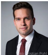
Gabriel Wikström (S), Hälso-, sjukvårds- och idrottsminister